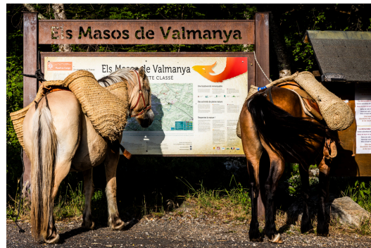
Porte de site classé

Tout au long de l'année 2025, des animations seront proposées par le Syndicat mixte pour marquer le renouvellement de ce label d'excellence , avec des temps de partage ouverts à tous pour célébrer les richesses patrimoniales et humaines du Grand Site de France.