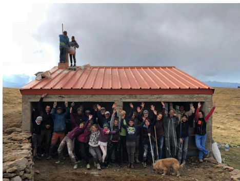
Chantier participatif