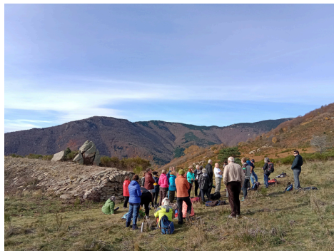
Visite guidée du secteur Sant Guillem