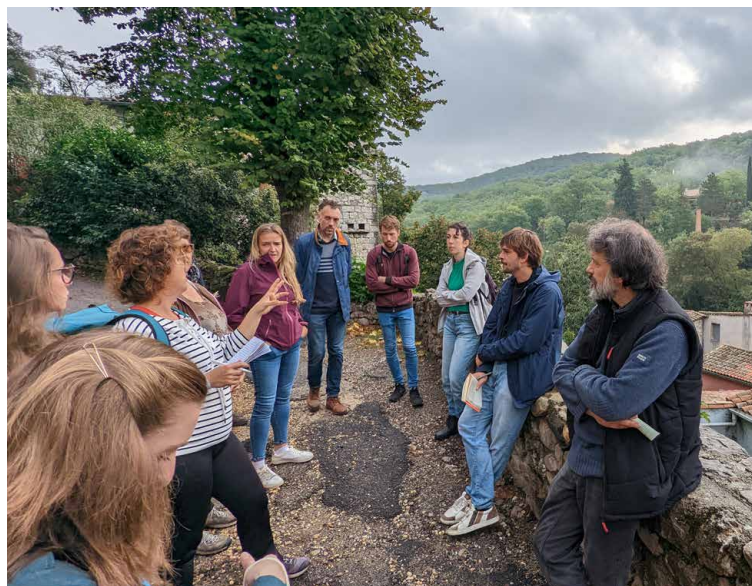
Lecture paysagère et énergétique lors du plan de paysage des Gorges de l'Hérault - Saint-Guilhem-le-Désert