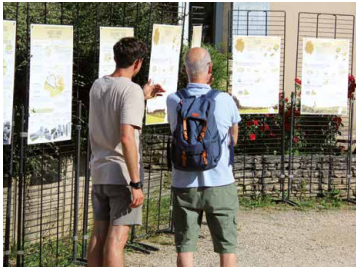
Exposition du plan de paysage transition énergétique à Vézelay