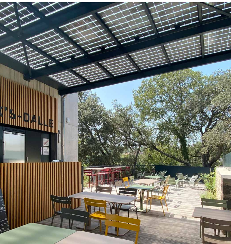
Ombrière photovoltaïque dans une maison de site des Gorges du Gardon

Se mobiliser pour une transition énergétique concertée, ancrée localement et de ce fait, efficiente et acceptée.