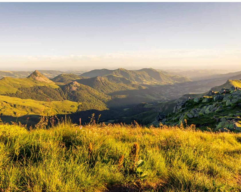
Paysage emblématique du Puy Mary - Volcan du Cantal source d'un refus par le tribunal administratif d'un projet éolien sans prise en compte du paysage

Les Grands Sites de France ont en commun d'être des paysages exceptionnels, connaissant une forte fréquentation touristique, classés pour une part significative de leur périmètre au titre de la loi de 1930. Les collectivités locales qui les gèrent sont engagées dans une politique partenariale avec l'État visant à trouver un équilibre entre préservation, accueil du public et développement économique local. Dans cet objectif, elles mènent des projets de territoire concertés, transversaux et cohérents en vue d'obtenir le label Grand Site de France attribué par le Ministre en charge de l'Environnement. Le Réseau des Grands Sites de France réunit les territoires engagés dans cette démarche. Depuis 2024, les Grands Sites de France sont intégrés aux Aires protégées.