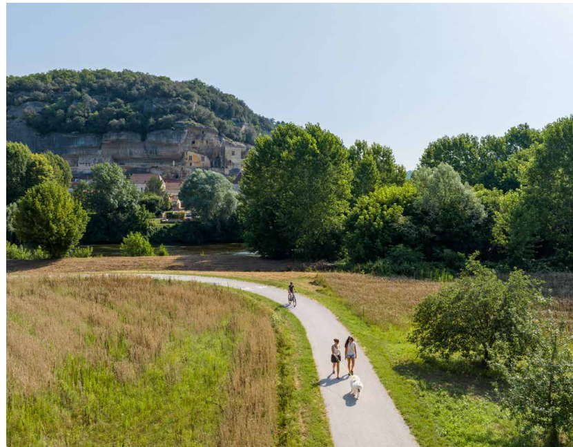
Intégration paysagère soignée d'une voie verte structurante en Vallée de la Vézère

Du temps à prendre aujourd'hui pour répondre aux enjeux durablement.