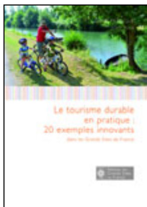
Photo du mois

Le Réseau des Grands Sites de France, avec la collaboration et le soutien du ministère en charge du Tourisme, du ministère de l'Environnement, de l'Energie et de la Mer et de la Caisse des Dépôts a publié un recueil de bonnes pratiques du tourisme durable ( http://www.grandsitedefrance.com/images/stories/docs/Guide_tourisme-BD.pdf ) basé sur 20 exemples innovants dans les Grands Sites de France.